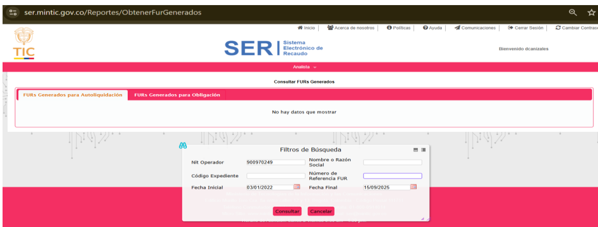
Imagen 1 FURs generados para autoliquidación

Pantallazo – consulta SER https://ser.mintic.gov.co/Reportes/ObtenerFurGenerados del 14 de septiembre de 2025.