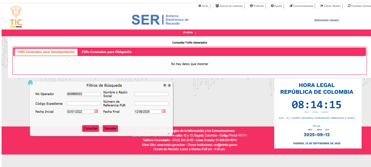
Imagen 1 Captura de Pantalla – FURs Generados para Autoliquidación