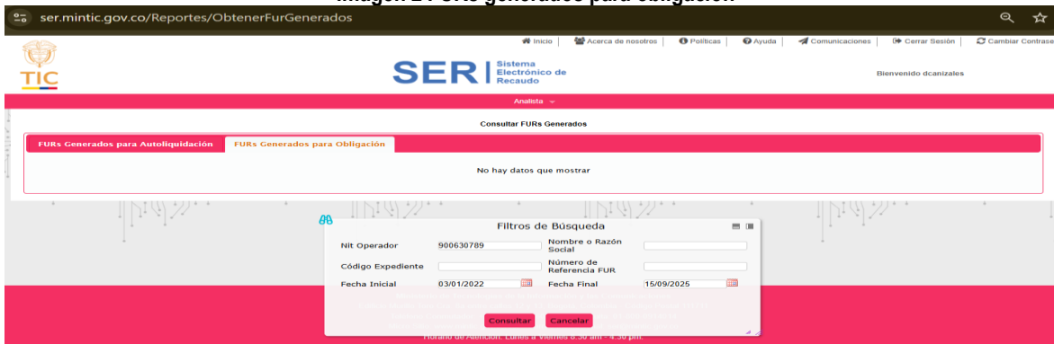
Imagen 2 FURs generados para obligación

Pantallazo – consulta SER https://ser.mintic.gov.co/Reportes/ObtenerFurGenerados del 14 de septiembre de 2025.