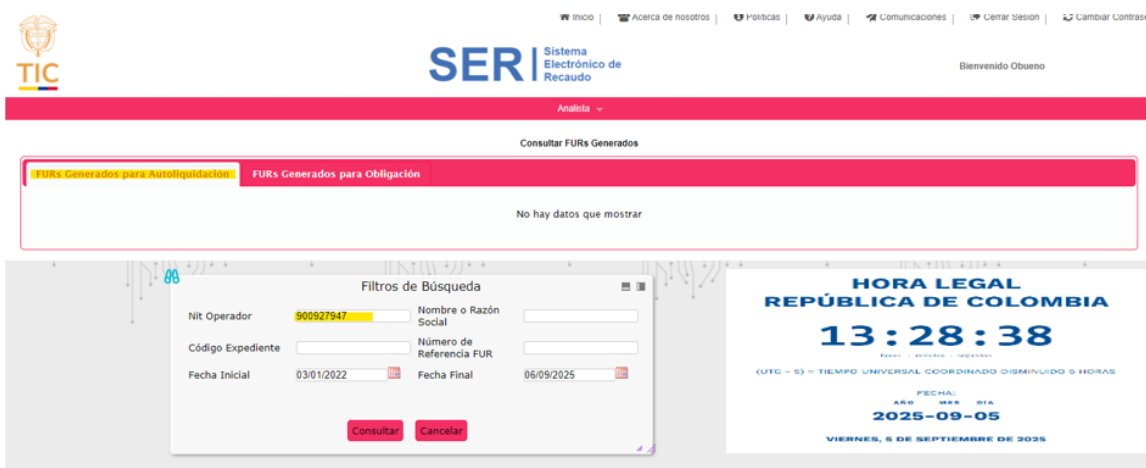
Imagen 1 Captura de Pantalla – FURs Generados para Autoliquidación