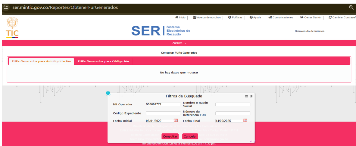
Imagen 1 FURs generados para autoliquidación

Pantallazo – consulta SER https://ser.mintic.gov.co/Reportes/ObtenerFurGenerados del 13 de septiembre de 2025.