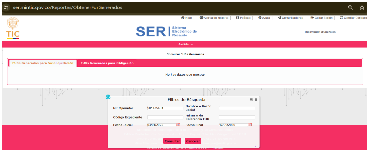
Imagen 1 FURs generados para autoliquidación

Pantallazo – consulta SER https://ser.mintic.gov.co/Reportes/ObtenerFurGenerados del 13 de septiembre de 2025.