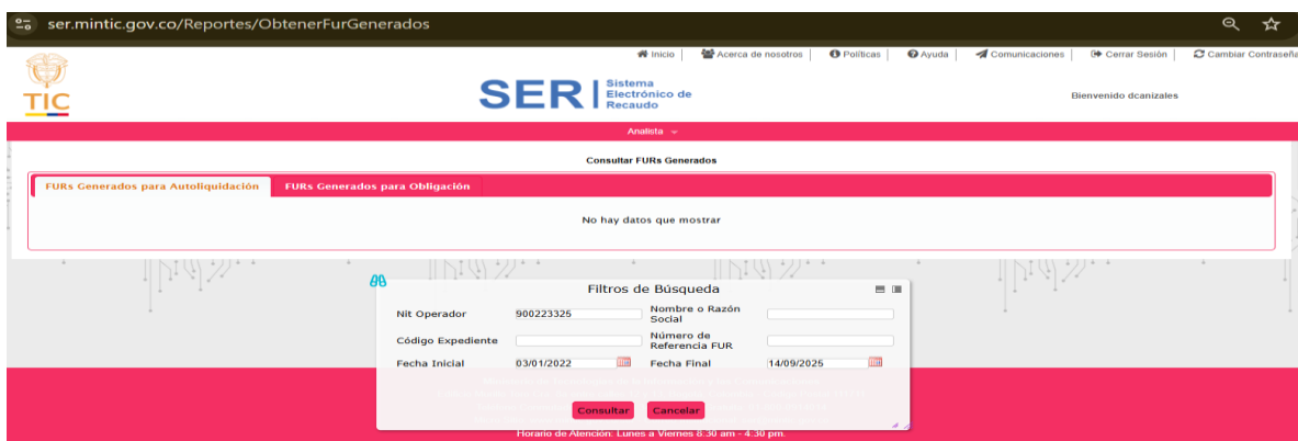
Imagen 1 FURs generados para autoliquidación

Pantallazo – consulta SER https://ser.mintic.gov.co/Reportes/ObtenerFurGenerados del 13 de septiembre de 2025.