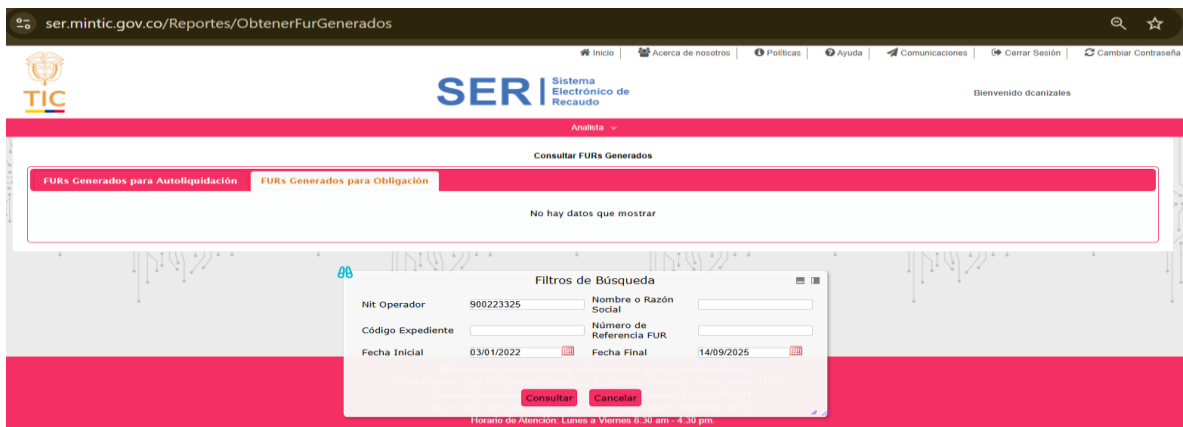
Imagen 2 FURs generados para obligación

Pantallazo – consulta SER https://ser.mintic.gov.co/Reportes/ObtenerFurGenerados del 13 de septiembre de 2025.