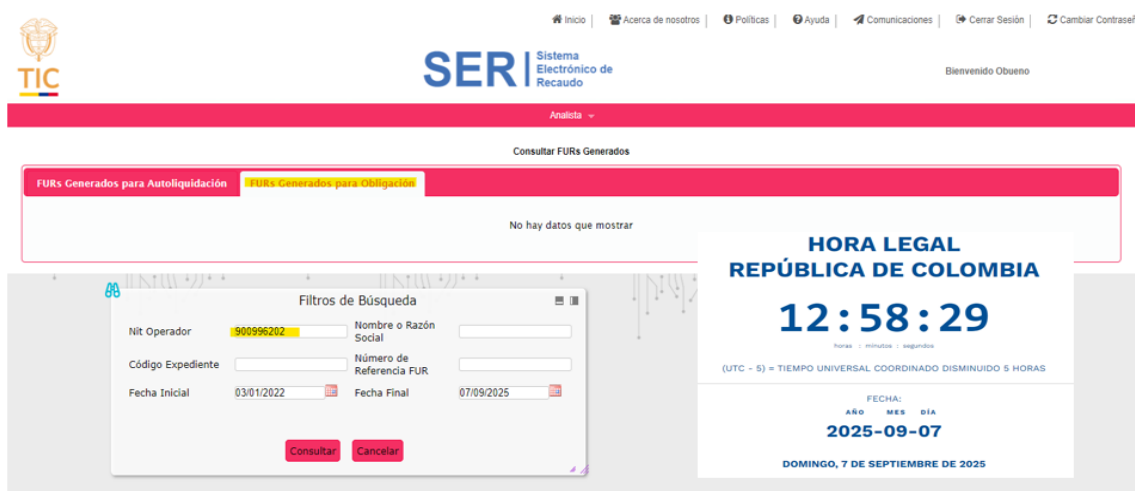
Imagen 2. Captura de Pantalla – FURs Generados para Obligación