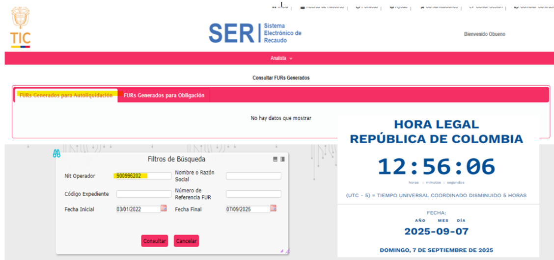
Imagen 1 Captura de Pantalla – FURs Generados para Autoliquidación