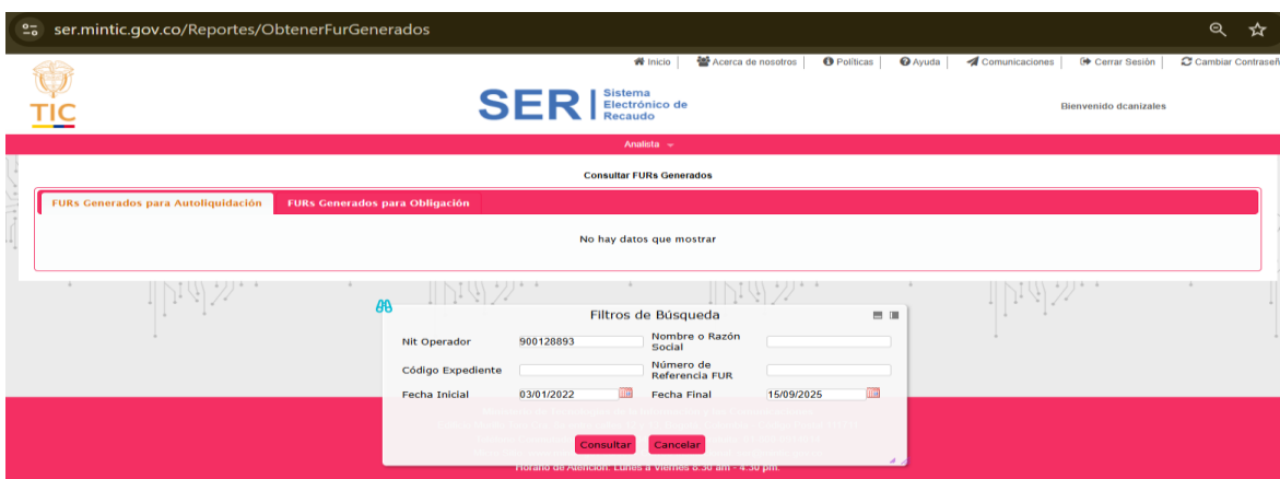
Imagen 1 FURs generados para autoliquidación

Pantallazo – consulta SER https://ser.mintic.gov.co/Reportes/ObtenerFurGenerados del 14 de septiembre de 2025.