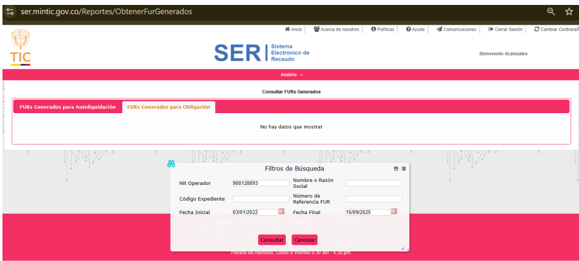
Imagen 2 FURs generados para obligación

Pantallazo – consulta SER https://ser.mintic.gov.co/Reportes/ObtenerFurGenerados del 14 de septiembre de 2025.