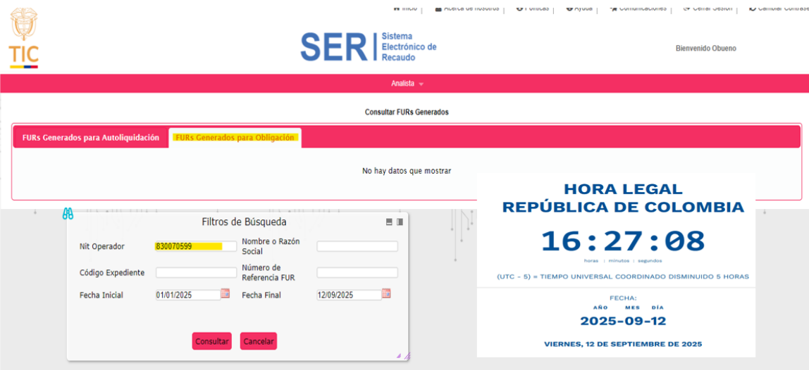
Imagen 2. Captura de Pantalla – FURs Generados para Obligación