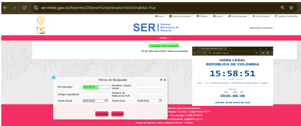
Imagen 001: Verificación en el SER vigencia 2022

Pantallazo – consulta SER https://ser.mintic.gov.co/Reportes/ObtenerFurGenerados del 26 de junio de 2025.